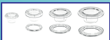
Ollaos + Arandelas Plástico Plastic Grommets + Washers